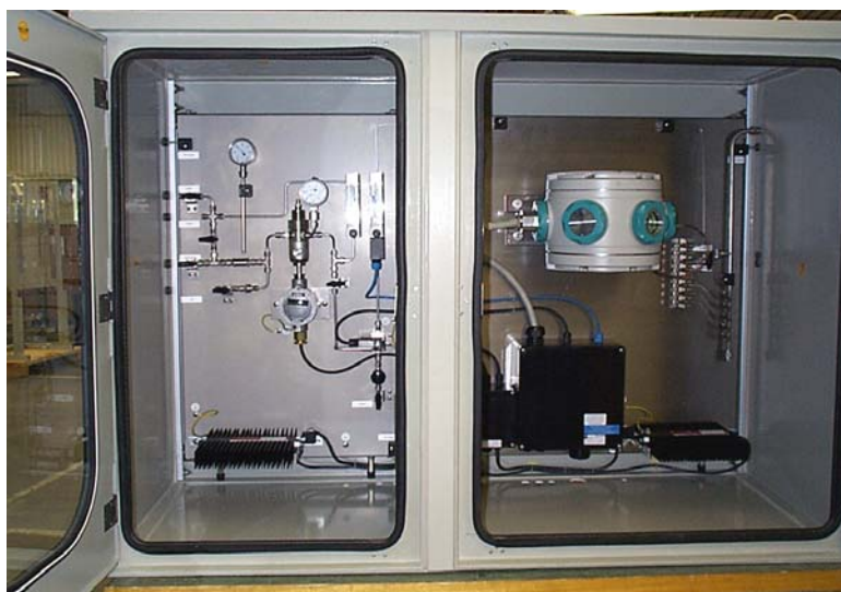
Пример аналитической системы, предназначенной для установки в обогреваемом помещении

Обычно, в состав такой системы входят специальный пробоотборный зонд со станцией редуцирования пробы, прогреваемые линии подвода пробы и вторичная система пробоподготовки.